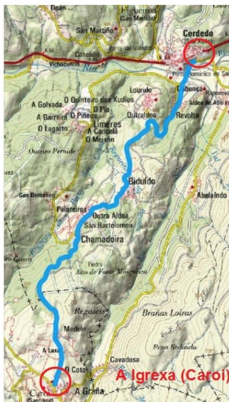
Proposta de Plan especial.